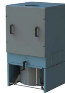
CFR Kasetinis Roto-filtrai

Oro kiekis: iki 560 m³/h Slėgis: iki 5000 Pa Filtravimo plotas: 3 iki 3.75 m²