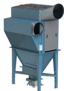
CQFG Jet filter

Luchtvolume : t/m 45000 m 3 /h Onderdruk : t/m 5000 Pa Filter oppervlakte : 312 tot 840 m 2