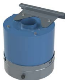
HOUF Olienevel voorafscheider filter

Luchtvolume : t/m 2000 m 3 /h Onderdruk : t/m 2000 Pa Filter rendement : normaliter t/m 85%