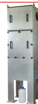
HGOF olienevel filters

Luchtvolume : 2.500 t/m 20.000 m 3 /h Onderdruk : tot 2.500 Pa