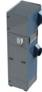
CFL Plug &amp; Play patronenfilter

Luchtvolume : t/m 8200 m 3 /h Onderdruk : t/m 5000 Pa Filter oppervlakte : 26 tot 168 m 2