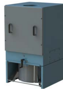
CFR compact Roto-patronenfilter

Luchtvolume : t/m 560 m 3 /h Onderdruk : t/m 5000 Pa Filter oppervlakte : 3 tot 3.75 m 2