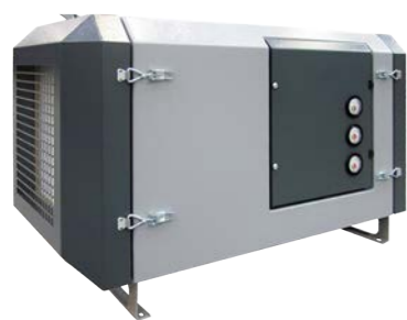
HOUPC Olienevel filter

Luchtvolume : 500 t/m 4000 m 3 /h Onderdruk : t/m 5000 Pa Filtratie rendement : H13