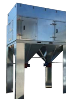
CERV rechthoekig filter met verticale patronen